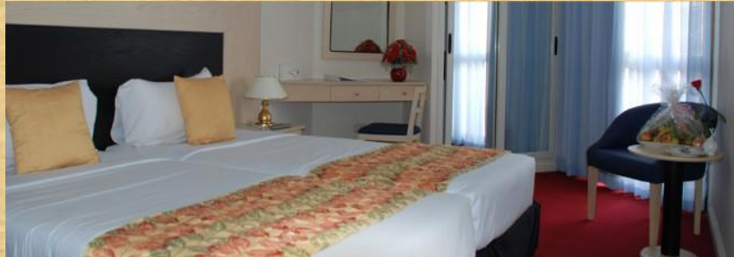
Foto habitación hotel Horizon Pyramids

4 **** Primera: Hotel Horizon Pyramids (Cairo). Crucero Nilo M/N Rosetta