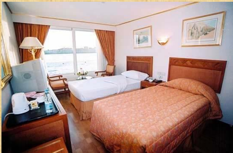
Foto camarote Ti-Yi

Crucero Lago Nasser M/N Nubian Sea Lujo o similar (para todas las categorías).