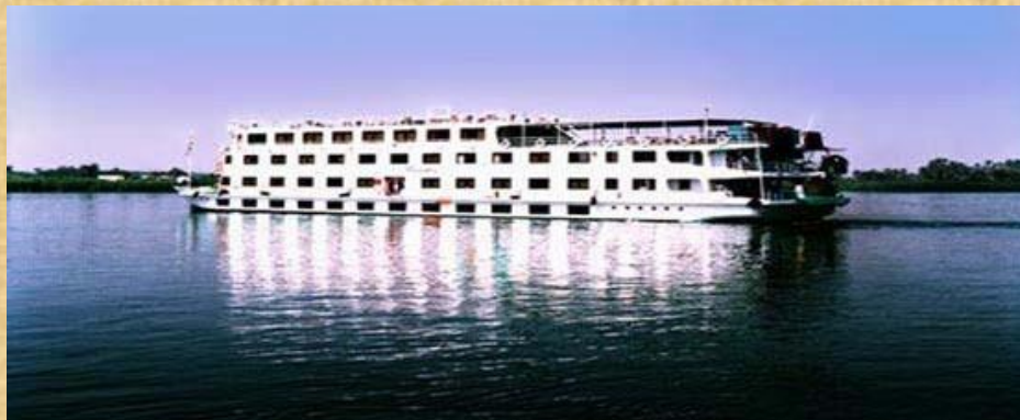
Foto M/N Rosetta

5****: Hotel Grand Pyramids (Cairo). Crucero Nilo M/N Nile Jewel